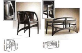
Art Nouveau akımının içinden sirlmiş tasarımcı Van de Velde tasarımı mobilyalar.

Fransa’da “L’art Nouveau” (yeni sanat) adıyla anılan, empresyonizm ekolünü temel alan akımda düz çizgiler, geometrik biçimler ve renkli egemen bulunmakta ve doğanın, özellikle bitkilerin stilize edilmesi esas alınmaktadır.