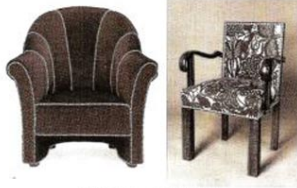
Hoffman Tasarımı Mobilyalar

Hızlı kentleşmenin getirdiği yeni yapı ihtiyacı kolay ve hızlı kullanılan demiri bir müdeet sonra daha fazla tercih edilir duruma getirdi. Demri ve çeliğin yapımı, mühendislik bilgilerine duyulan ihtiyacı daha da arttırdı. Hatta mühendisler, mimarlığın yanı sıra