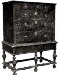
1700'lerde kullanılan mobilya örnekleri

Genel olarak "Taşra Mobilyası" diye adlandırılan bu mobilyalar Almanya'da "Bauer", Fransa'da "Provincial" gibi adlar almıştır. Bu tip mobilyalar geçmiş stillerden izler taşırsa da sadeleşme eğilimi ağır basmaktadır. Genellikle oyma ve kabartmalar tümenden kalkmış, ayaklar düz ya da eğmeçlidir. Süslemede birkaç aplik çitası yeter bulunmuştur. Yakınçağda yenileşme döneminin en geniş çalışmaları Almanya'da gerçekleştirilmiştir. Bu çalışmalar çağımızın mobilyasını gerek