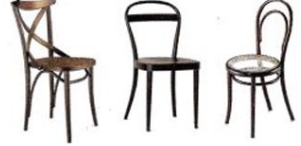
Bent Wood Tekniği ile yapılmış, Michael Thonet Sandalyeleri, 1840

XIX. yüzyılın ortalarına doğru makine sanayiinin gelişmeye başlaması, özellikle Avusturya, Fransa ve İtalya'da sürekli üretim mobilyası olarak "Hezaren" sandalyelerin yapımına başlanmıştır. Hezaren bir tür bambu ve Hint kamışının adı olup, yerlilerce bu kamışlardan bükülerek ve ağaç lifleriyle örülerek yapıldığı için bu adı almış olması düşünülebilir. Aynı yöntem günümüzde de çok tutulan hasır sandalye ve koltuklara uygulanmaktadır. Hezaren sandalye önce tornada yuvarlatılan çubukların buharla yumuşatılarak, kalıplarda istenilen ölçü ve formda bükülmesiyle elde edilmektedir. Bu parçalar cıvata ile birbirine bağlanmakta, oturma kısmı ve arkalık, kontrplak veya sırm ile örülerek kapatılmaktadır. İlk fabrikasyon bükme mobilyayı Avusturyalı Michael Thonet (1840) yılında gerçekleştirmiş ve bu tasarım o kadar başarılı olmuştur ki, 1841 yılında patentini Fransa, İngiltere ve Belçika'ya