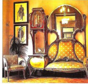
Art Nouveau Stilinde Mobilya ve İç mekan düzenlemesi

Arts&Craft hareketini ; basit, kullanım amacına ve materyale uygun mobilya imal etme akımları takip etmiştir. Almanya’da “Jugendstil”,