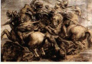
Battle of Anghiari - Leonardo da Vinci, detay, 1503-1505

gerekli anatomi bilgisiydi – bu bilgiyle güzel bir insan vücudunun kusursuz şekilde gösterilmesi gerekiyordu, o dönemde güzel ve değerli olarak kabul edilen her yapıtta yer alan klasik mimari bilgisiydi.