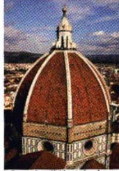
Duomo'nun Kubbesinden detay, Floransa, Brunelleschi

yüzeyi armalarla süslü dört köşe taşlarla, duvarlar alegorik desenlerle ve halılarla kaplı olduğunu görebiliyoruz. Gotik dönemin sonuna doğru, Rönesans'la birlikte, döşeme