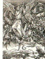
Albert Dürer, Aziz Mikhael'in ejderle savaşı, 1498 Kilise kurumlarına karşı duyulan genel hoşnutsuzluğu, dönemin sanatçısı Dürer'inde eserlerinde dile getirdiğini görürüz.

klasik edebiyatın ya da sanatın yeniden doğuşundan çok, insan düşüncesinin yeni atılımlarına bağlı olarak şekillenir.