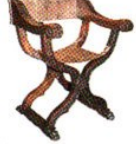
İtalyan Rönesans örneği koltuk: Düzgün kenarlı geniş eğmeçler dışında,antik mobilyanın yinelenmesi sayılabilecek bir örnek.