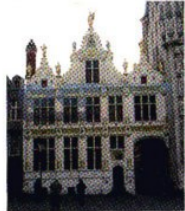
Değişime uğramış Gotik cephe örneği, Jan Wallot ve Christian Soudeniers, Eski Kaşıkçıları Binası, Bruges, 137,1537

İç Mimarî kavramını, belki de o tarihlere kadar göremiyor diyebiliriz. Bu konuda bilgilerimiz eski belgelere, resim ve minyatürlere borçluyuz. O dönemlere ait resimlerde; oturma odalarında, taban cilalı ve