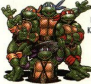
Fantastik çizgi serisi 'Ninja Kaplumbağalar'daki dört ana karakter, isimlerini döneminin dört büyük sanatçısından almıştır.

Mimarlar aslında zor olan bir dönemde geçiyor, çeşitli geleneklerin yeni bilgiler karşısında başarıya ulaşmak için epey çaba gösteriyorlardı. Alışmış oldukları Gotik sistemi de, yeniden ortaya çıkan antik mimari biçimleri de belki aralarında en azından kurumsal olarak tam anlamıyla tutarlıydı ama her iki üslubun amaçları ve özellikleri birbirlerinden son derece farklıydı. Bu nedenle, mimarideki yeni akımların kuzeyde benimsenmesi çok zaman aldı. Bu iş daha