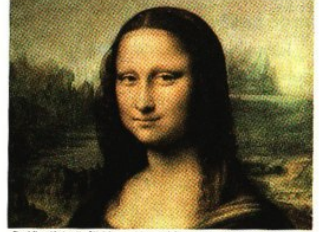
Da Vinci'nin ünlü Mona Lisa tablosu, resim sanatı deyince neredeyse aklımıza ilk gelen eserdir.

Antikçağ'ın sonunda başlayıp Rönesans'la sona eren, Avrupa'nın üzerine serilmiş 'bin yıllık karanlık' olan Ortaçağ'da, ne fikirlerin ne de insanların hiç bir değeri yoktu. Din ve kilisenin ağırlığı her alanda hissediliyordu. Katolik kilisesi kendi ordusu ve yönettiği kentlerle güçlü bir devlet durumundaydı. İnsanlara; basit iftiralara, nedenler yüzünden engizisyon mahkemelerinde ölüm fermanları yazılabiliyordu. Toplumlarda inanç, ticaret, iletişim, toplumsal, etkileşim, cinsellik ve özel mülkiyet gibi insanların sahip olduğu doğal hak ve özgürlükler üzerinde, dinsel otoritenin koymuş olduğu sınırlamaların ve yasaklamaların kaldırılması, tüm toplumun bu tür hak ve özgürlüklerden eşit olarak yararlanmasını gerektirdi inancı yerleşmeye başladı. Rönesans bakış açısında temel özellik; "insan" denen varlığın değerinin anlaşılmasının sağlanmasıydı. 15.yy dan itibaren "yeniden doğuş" düşüncesinin sistemli bir biçimde geliştirildiği izlenmektedir. Birey, bütün toplumsal eylemlerin ve bilginin başlangıç noktası olarak, bir üst otoriteye bağlı olarak ele alınmamalıydı, Rönesans kültürü organik bir bütündür ve "dünyanın ve insanın keşfi"