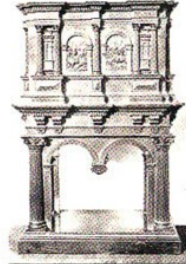
Büfe : Sandıktan büfeye geçişin bir örneğidir. Yukarıda da değişim gibi, Rönesans'ın ilk uygulamaları, yeni bir üslubun araştırılması içinde geçiş, olabildiğince süslemeliğe yönelmiştir. Büfe, bunun tipik bir örneğidir.

Rönesans etkisiyle, İngiltere'de 16. yüzyıl sonları ve 17. yüzyıl başlarında adını İngiltere Kraliçesi I. Elizabeth'den alan Elizabeth üslu-